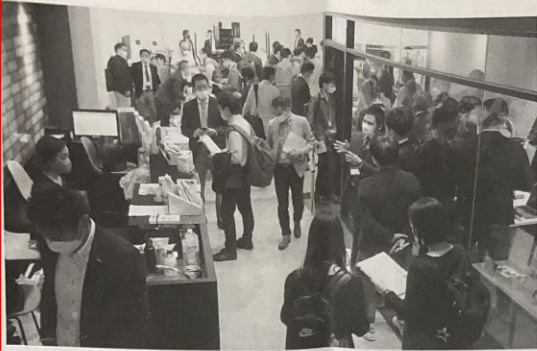
コンパクトな会場、ブースで商談も活発に

本報記者 山本 隆之 東京 会場には、多くの参加者が、ビジネスマッチングの場を求めて集まっていた。会場には、多くの参加者が、ビジネスマッチングの場を求めて集まっていた。