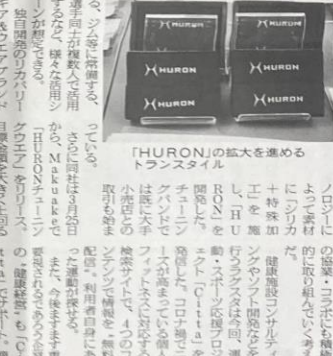
HURONの拡大を進めるトランススタイル

スポーツヘルスケアOneDay2022は、ヘルスケア分野の健康意識の高まりに対応し、出展・来場者のメリットを最大化するイベント。