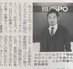
「eep」の創業者、代表取締役社長

「eep」の創業者、代表取締役社長は「コロナ禍で、ビジネスマッチングの場を求めて集まっていた。会場には、多くの参加者が、ビジネスマッチングの場を求めて集まっていた。」